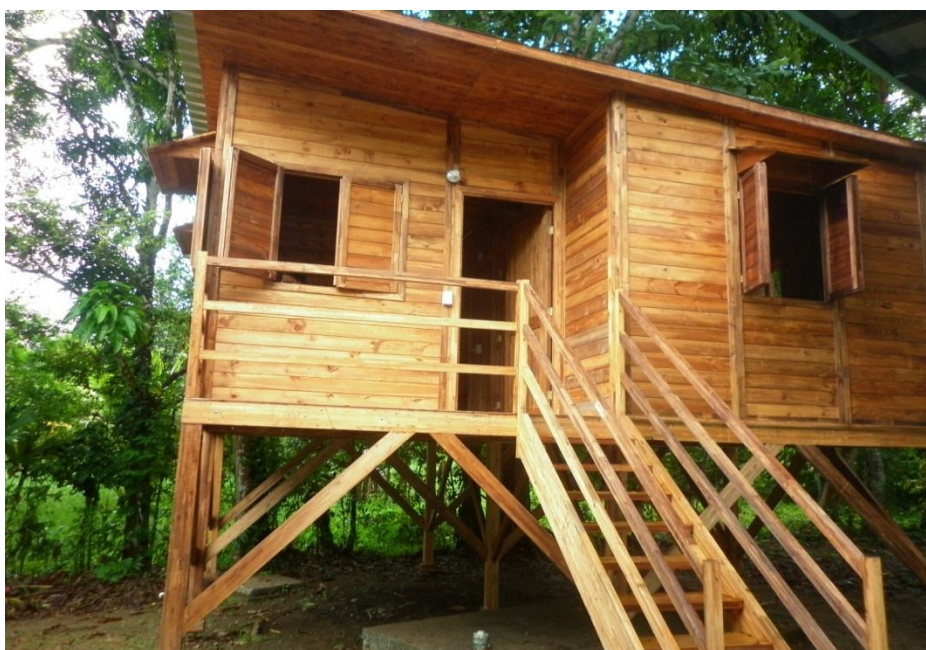
Modelo de la Vivienda aprobada por el CGEW