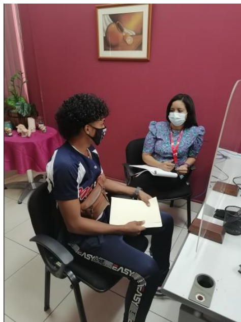
Atención de Trabajo Social