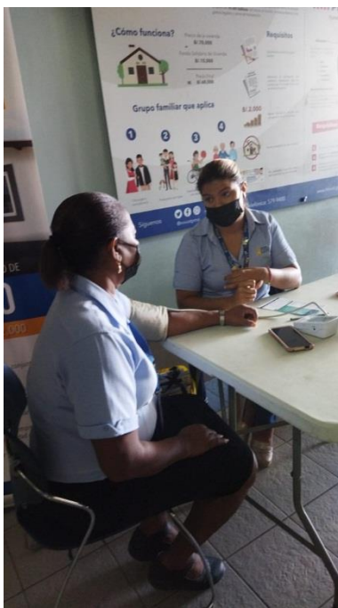
Feria de Salud, sede central Plaza Edison