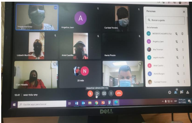
Charla sobre La imagen y presentación, según la personalidad