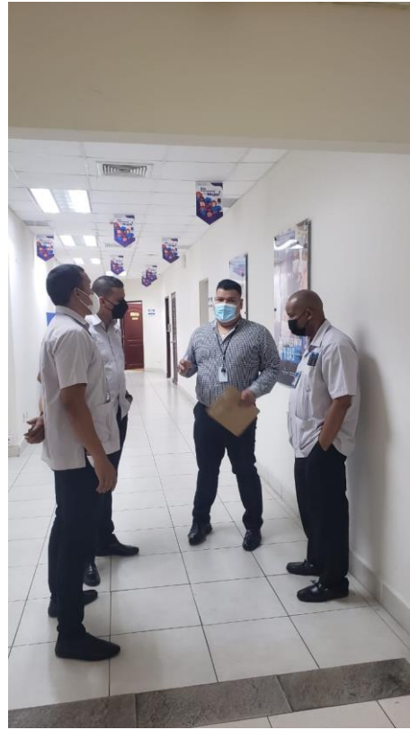
Inducción a los colaboradores del departamento de seguridad