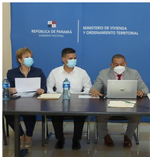
Seminario sobre guías de procedimiento del Departamento de Transporte y Talleres