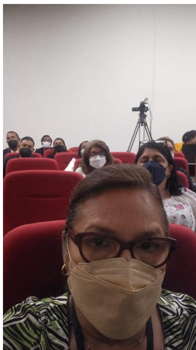
Participación de la conferencia académica en el Centro de Capacitaciones de la Procuraduría de la Administración sobre Reflexiones sobre COVID-19 en Panamá